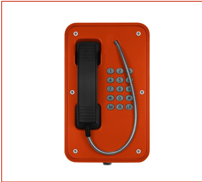
Teléfono resistente a la intemperie